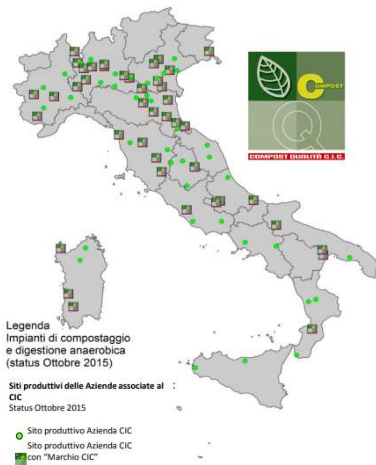
Figure 1: Aziende CIC e aziende con "marchio CIC" al 2015

Esistono tuttavia, anche impianti del sud che hanno ottenuto questo marchio come quello sito a Laterza (TA) -Progeva srl- che è autorizzato al trattamento di 70.000 t/anno di frazioni organiche di rifiuti per la produzione di Ammendante Compostato Misto, ottenuto attraverso un processo di trasformazione e stabilizzazione controllato di rifiuti organici. FONDAMENTALE DIFFERENZA TRA L'IMPIANTO PROPOSTO DALLA BIEN srl E PROGEVA srl (riportato a titolo di esempio) E' QUINDI LA FINALITA' DELL'IMPIANTO IN QUANTO QUELLO DA LOCARE IN TITO NASCE PER IL TRATTAMENTO DI SOTTOPRODOTTI.