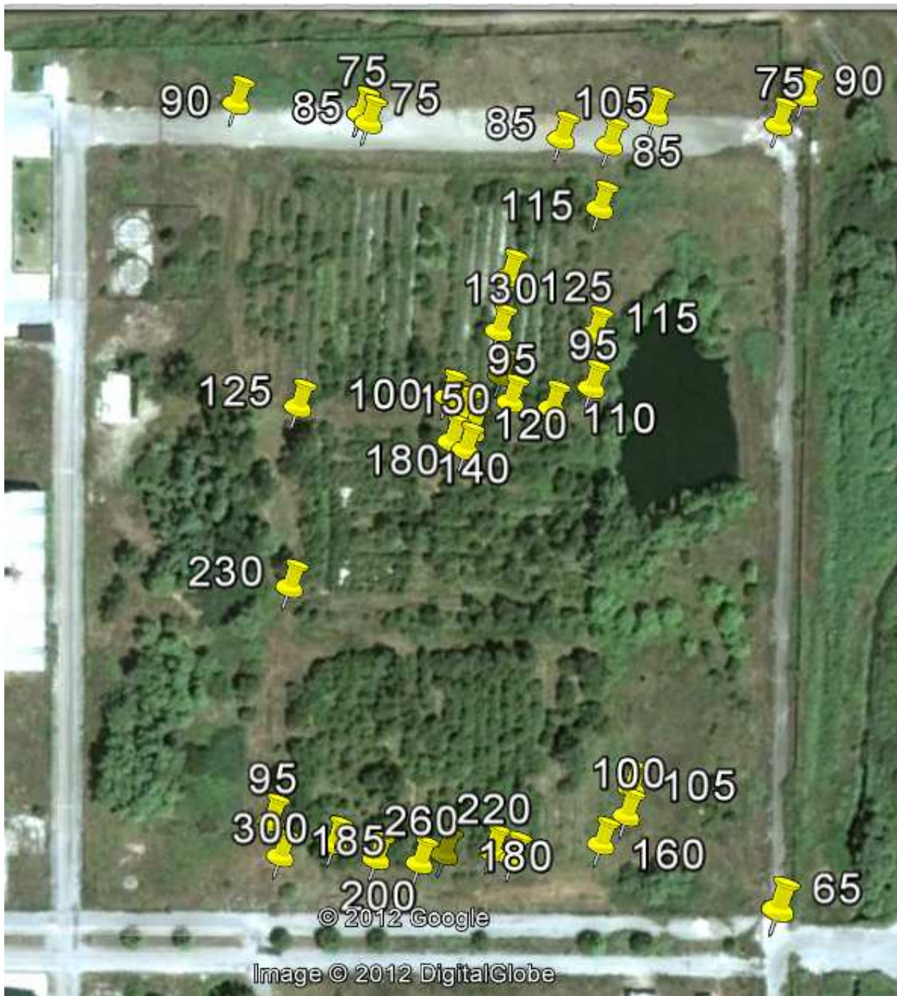
Figura n. 2. Mappa dei valori di dose misurati